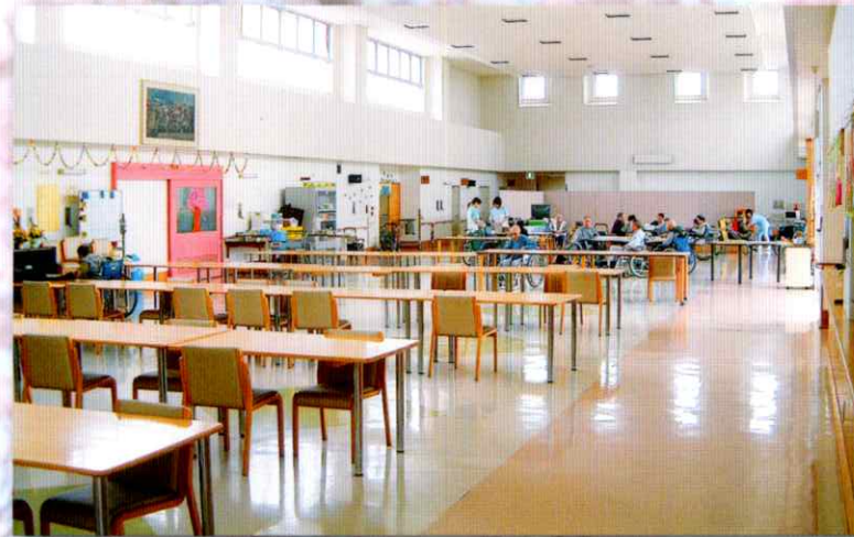
食堂・レクリエーションホール